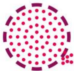
Melgang met borstkanker

Kanker is een ingrijpende ziekte. Alles waar u mee te maken krijgt voor, tijdens of na de behandeling hebben we voor u verzameld op onze pagina 'Kanker' ( https://www.jeroenboschziekenhuis.nl/kanker ).