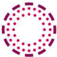
Melgang met DCIS

In de borst zitten klierkwabben (lobuli) en melkgangen (ducten). Op deze plaatsen kunnen kankercellen voorkomen. Als deze kwaadaardige cellen binnen de begrenzing van de melgang blijven, spreken we van borstkanker in situ. Dit is een voorstadium van kanker, waarbij de cellen al wel de vorm hebben van kankercellen, maar nog niet het vermogen hebben om in het omliggende weefsel door te groeien en eventueel uit te zaaien.