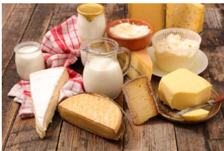
Foto van melkproducten