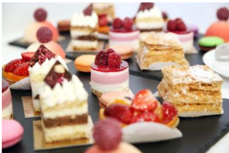
Foto van zoete tussendoortjes