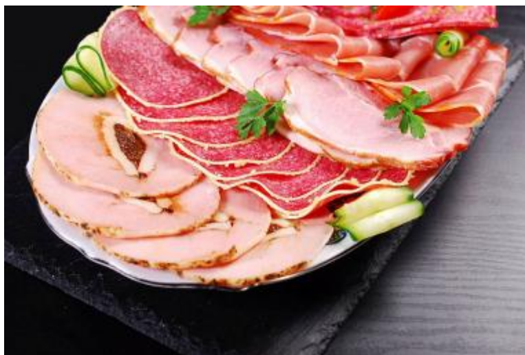
Foto broodbeleg vleeswaren