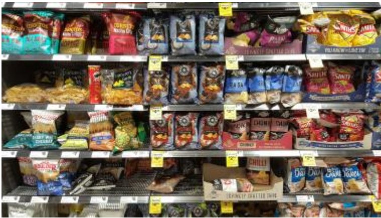
Foto schap met snacks