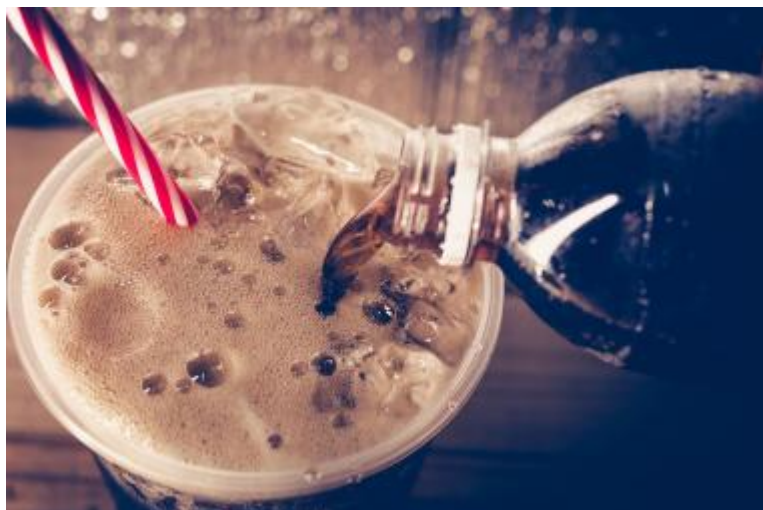
Foto glas cola bij overige producten