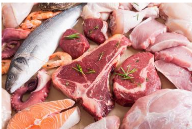
Foto vlees, vis gevogelte