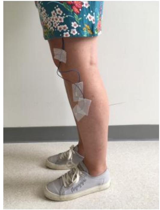
Foto: benen met elektroden