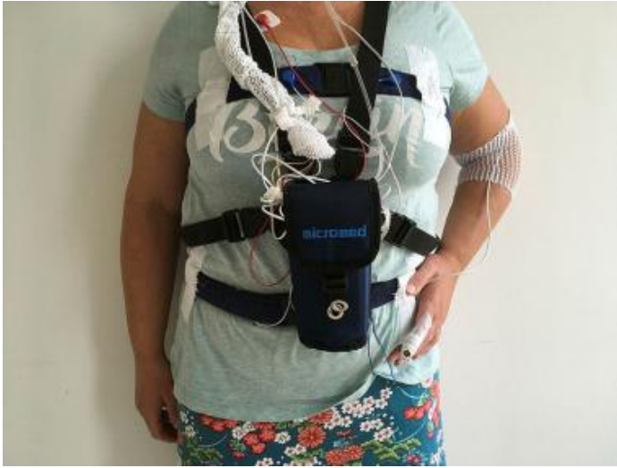
Foto: lichaam met elektroden