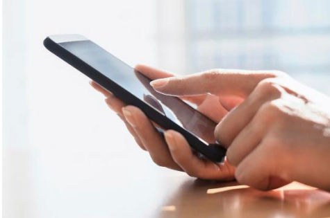
Foto: mobiele telefoon