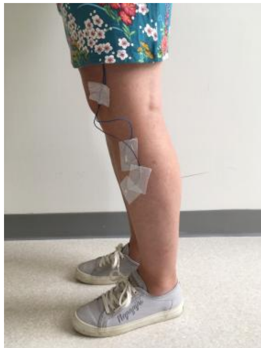
Foto: benen met elektroden