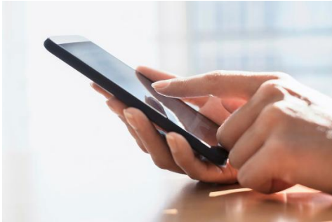
Foto: mobiele telefoon