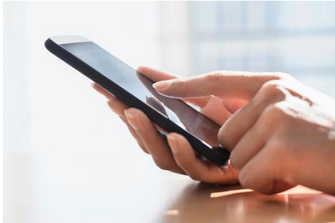
Foto: mobiele telefoon