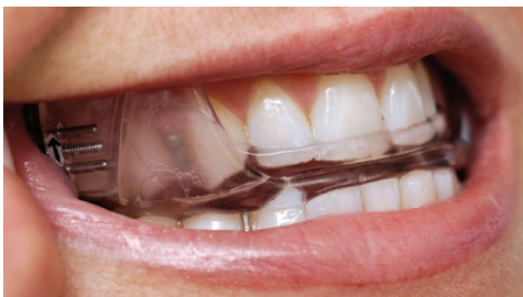
Foto: MRA beugel

Haal de stekker van uw (water)bed of elektrische deken uit het stopcontact.