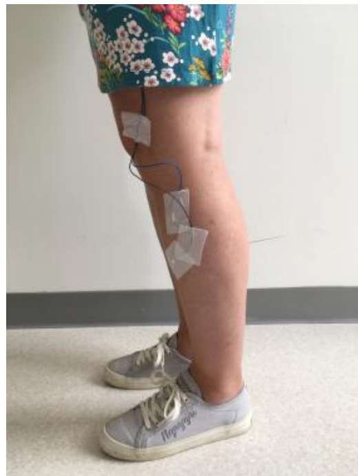
Foto: benen met elektroden