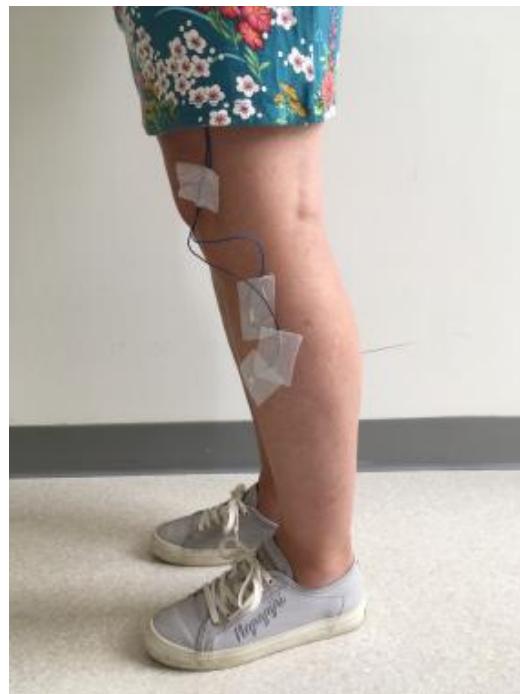
Foto: benen met elektroden