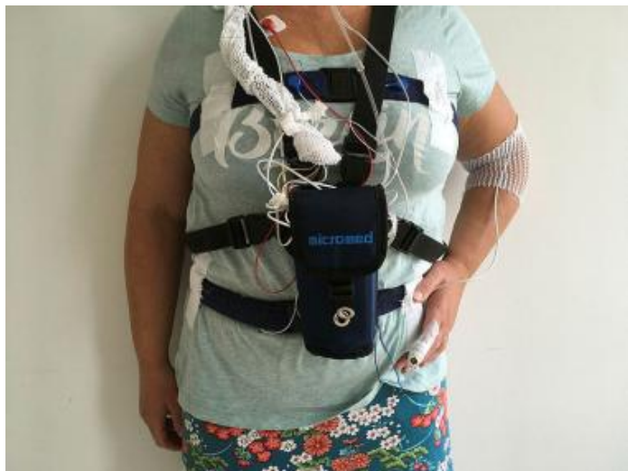
Foto: lichaam met elektroden