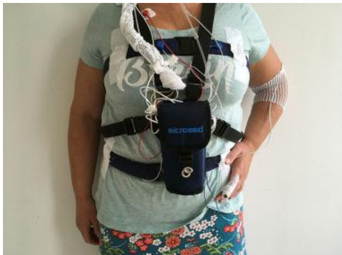
Foto: lichaam met elektroden